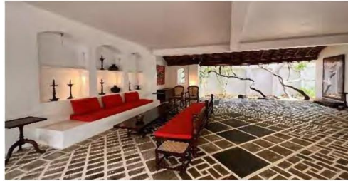
4泊目：ルヌガンガ & No5 (旧エナ・デ・シルバ邸)

ホテルは全6泊、山口由美氏が厳選した個性あふれる4つのバワホテルに滞在いたします。また各自の志向やスタイルでバワの世界をお楽しみいただけるよう、各ホテルで自由に過ごせるフリータイムをご用意しております。