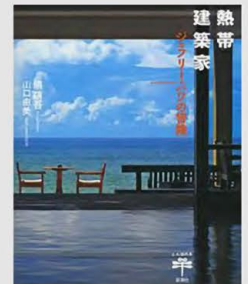
熱帯建築家 (新潮社)