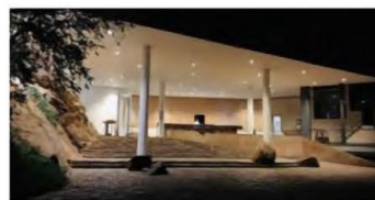
5 & 6泊目：ヘリタンス・カンダラマ