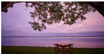
1泊目：ジェットウィング・ラグーン