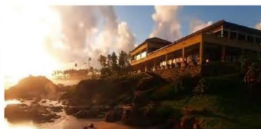
2 & 3泊目：ジェットウィング・ライトハウス